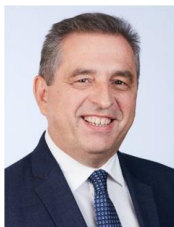
Δημήτριος Βασιλόπουλος , Καθηγητής Ιατρικής Σχολής, ΕΚΠΑ